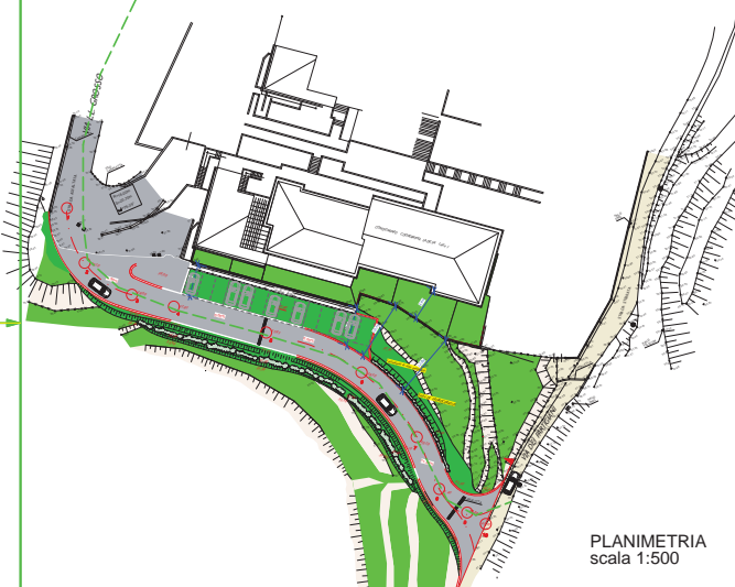
PLANIMETRIA scala 1:500

INTERVENTO PER LA REALIZZAZIONE DI UN NUOVO TRATTO DI STRADA A MIGLIORAMENTO DELLA VIABILITA' PUBBLICA IN LOC. LUCETO DA ESEGUIRE IN CONVENZIONE COMUNALE