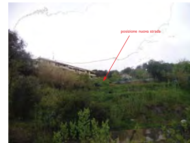
Vista da Via Grosso