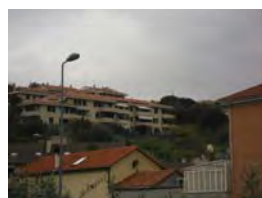
Vista dalla strada provinciale