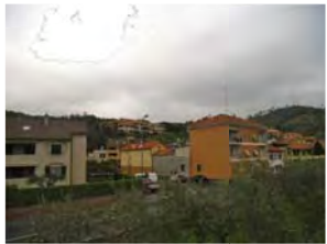
Viste dalla strada Via L. Saettoni - intervento non visibile