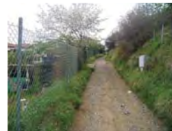
Vista dalla Via Dei Partigiani