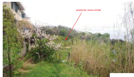
Vista dall'innesto via Grosso

○ Centro Storico di Luceto - prevista Zona Traffico Limitata